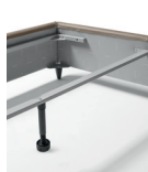
SUPPORTO RETI SINGOLE